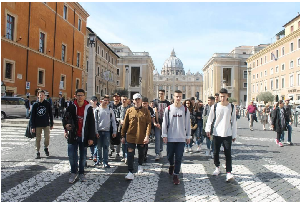
Gli studenti in Via della Conciliazione che si apre al suo termine in piazza San Pietro offrendone una splendida vista.