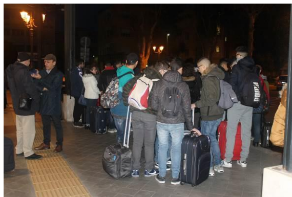
Il gruppo in partenza dalla Stazione di Brindisi