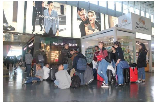
Stazione Termini. Si torna a casa.

Si ringraziano quanti hanno collaborato all' organizzazione e allo svolgimento di questo bel soggiorno romano ricco di stimoli culturali ed esperienze di socialità e partecipazione attiva.