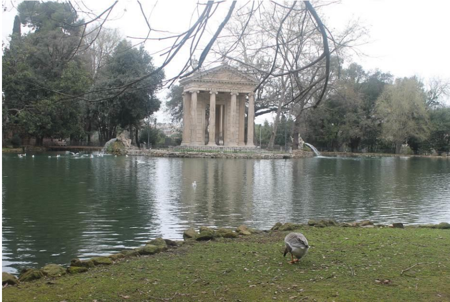
Tempio di Esculapio. Eretto su un isolotto artificiale del lago sito nel Giardino del Lago a Villa Borghese in stile squisitamente neoclassico e dedicato al dio della medicina.