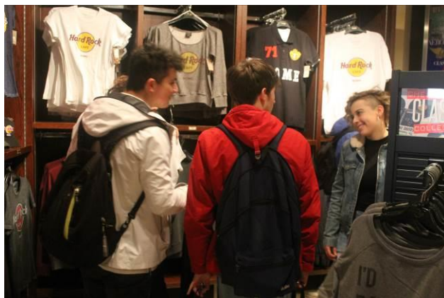
Hard Rock Cafè Roma. Un tempio per i giovani, tappa imperdibile in tutte le capitali.