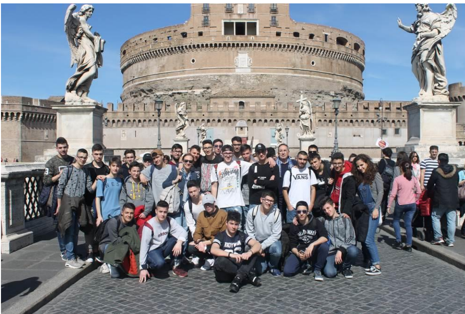
Castel Sant' Angelo. In origine eretto come mausoleo di Adriano (123), fu utilizzato in vari modi nel Medioevo (fortezza, caserma e prigione) prima di diventare, nel XV sec., residenza papale collegata a San Pietro da un lungo corridoio.