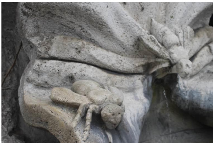
La Fontana delle Api. E' una fontana storica di Roma ubicata all' angolo di piazza Barberini con via Veneto, realizzata da Gian Lorenzo Bernini.