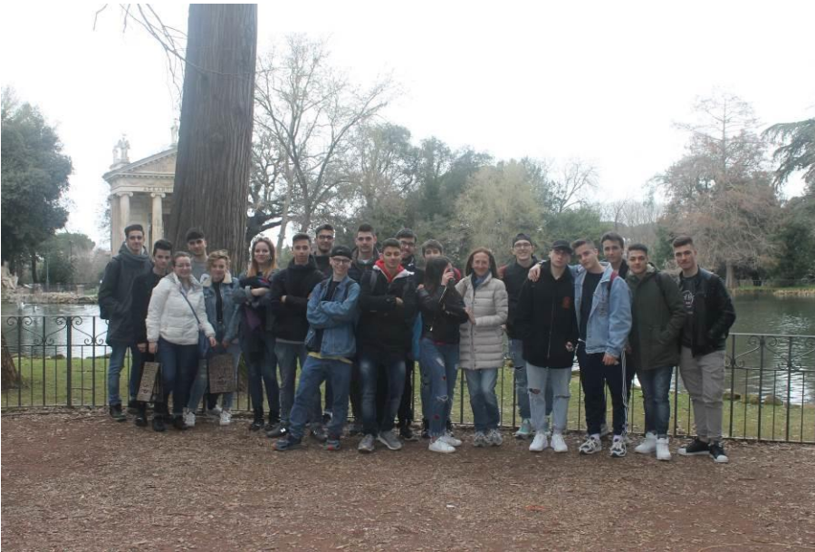
Foto di gruppo a Villa Borghese , il più bello dei parchi romani e uno dei più grandi, creato nel 1608 dal cardinale Scipione Borghese, dove si incontrano famiglie con il passeggio, musicisti ambulanti e patiti del jogging.