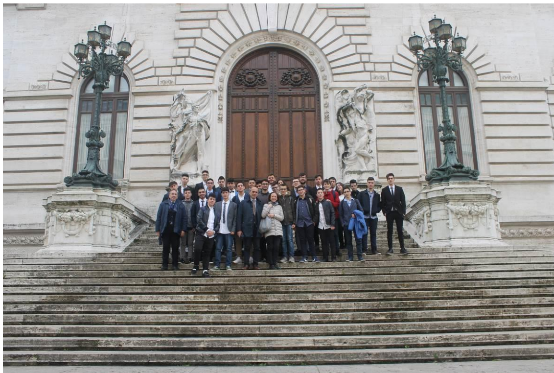
Rituale foto di gruppo sulle scale di Montecitorio

Nel testo dei Lavori della Camera dei Deputati del 07/03/2017 il saluto del Presidente agli studenti e insegnanti dell' Istituto tecnico –industriale Giorgi di Brindisi che assistono dalla tribuna