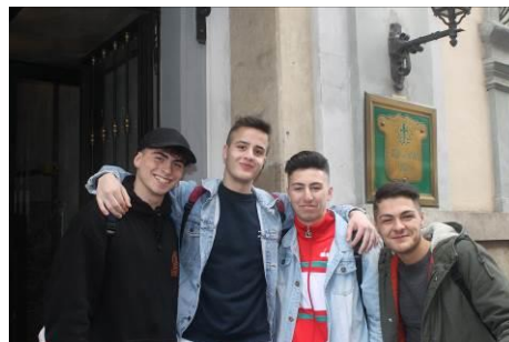
Arrivo in Hotel